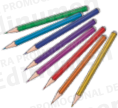
lápices de colores