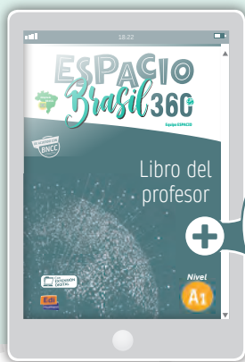
eBook libro del profesor