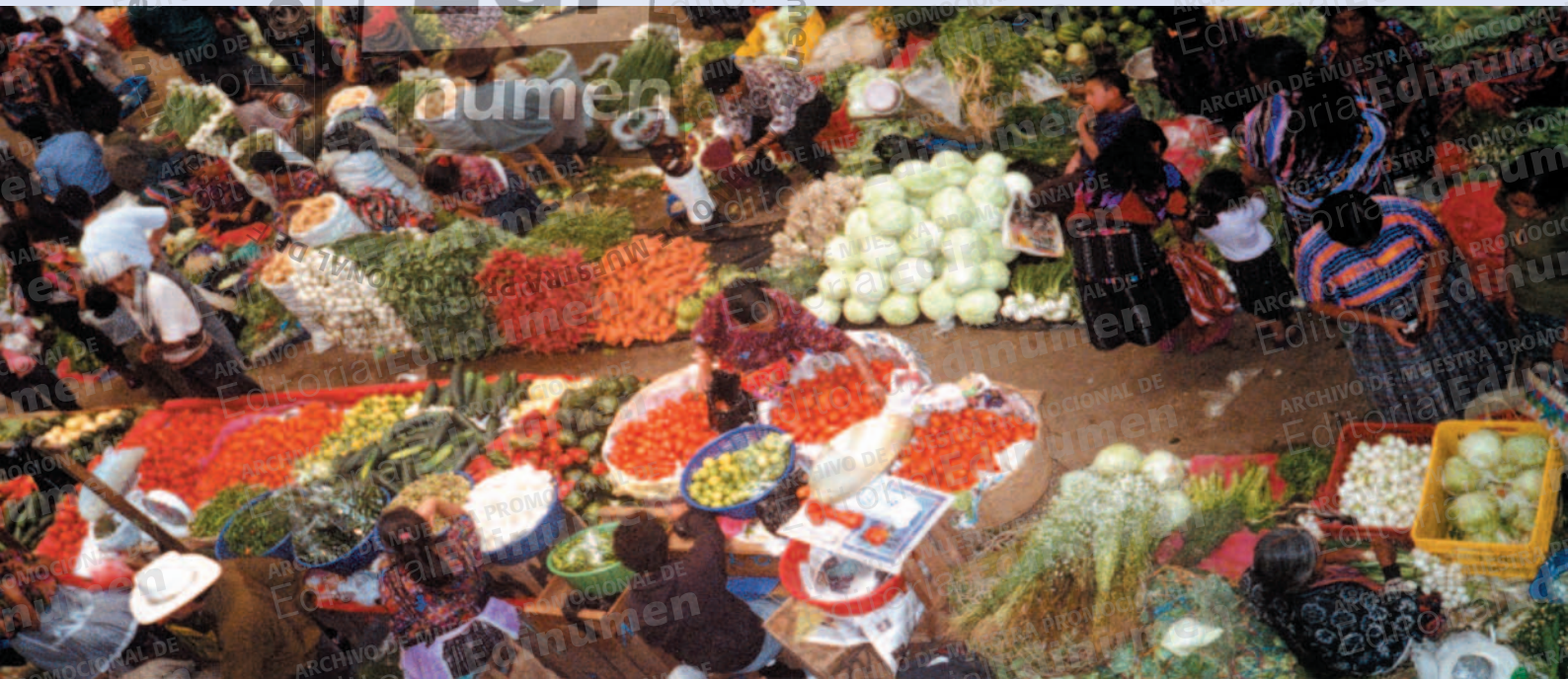
Mercado de Chichicastenango, Atitlán, (Guatemala)