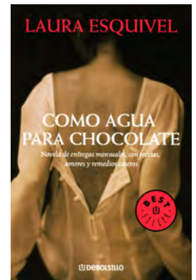
Como agua para chocolate de Laura Esquivel

John permaneció a su lado y fue testigo de cómo pasó Tita de las lágrimas a las sonrisas.