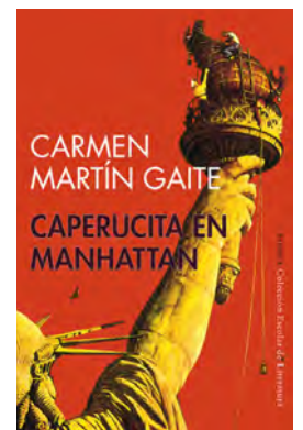
Caperucita en Manhattan de Carmen Martín Gaité

“Yo no pienso hacerles nunca tarta de fresa a mis hijos”, pensaba Sara para sus adentros.